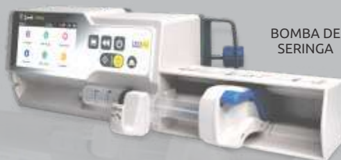
BOMBA DE SERINGA