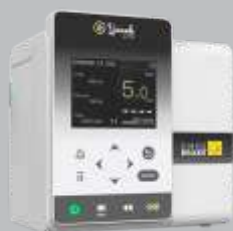
BOMBA DE EQUIPO PARENTERAL

CONHEÇA OS OUTROS MODELOS DA LINHA DE INFUSÃO YONAH