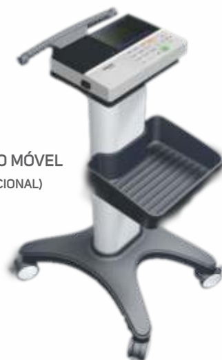
CARRO MÓVEL (OPCIONAL)